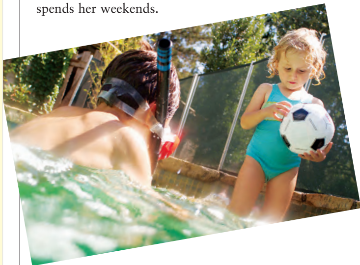
On essaie de faire beaucoup de choses avec les enfants